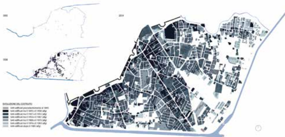
Fig.1_ Elaborato grafico dell'autrice.

mento pervenute a seguito delle inondazioni più significative e recenti precedenti l'inizio della tesi, ovvero quelle del Settembre 2009 e del Maggio 2010. Si tratta del bacino Padova Sud, un'area delimitata dalle mura cinquecentesche a nord nord-ovest e da due canali, il Canale Scaricatore a sud ed il canale San Gregorio ad est, costruiti entrambi tra la fine del 1800 e i primi del 1900. Questa netta separazione dai terreni adiacenti ha alterato il naturale deflusso delle acque: l'area di studio, che segue una pendenza naturale da nord-ovest a sud-est, si è trovata chiusa lungo tutto il proprio perimetro, comportandosi come un bacino di accumulo indipendente.