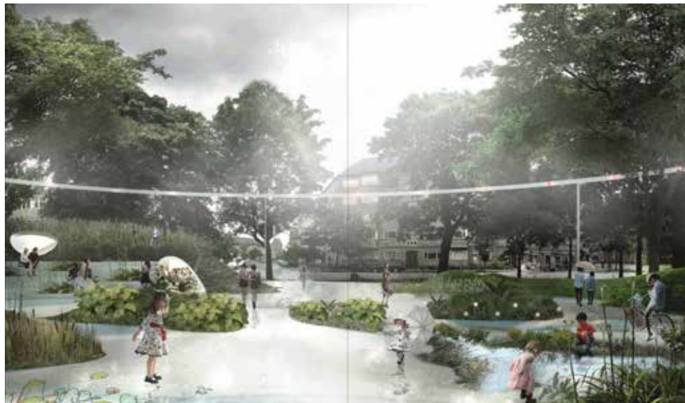
Fig.2 Tåsinge Square, Copenhagen. Tratto da Copenhagen Climate Resilient Neighbourhood.

Interventi peraltro non sufficienti in quanto il bacino è tuttora soggetto ad allagamenti che colpiscono sia parte dell'abitato – e possono quindi essere mappati attraverso le denunce – sia parte del territorio che è tuttora ineditificato.