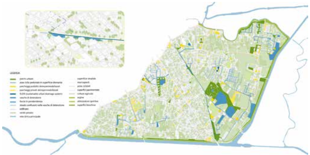
Fig.4_ Elaborato grafico dell'autrice

delle vasche di detenzione: collegate al sistema fognario, esse fungerebbero da collettori temporanei che possono essere svuotati una volta passato l'evento di pioggia intensa, quando la portata della rete fognaria abbia superato il momento di picco.