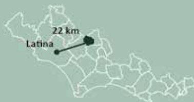
Provincia di Latina