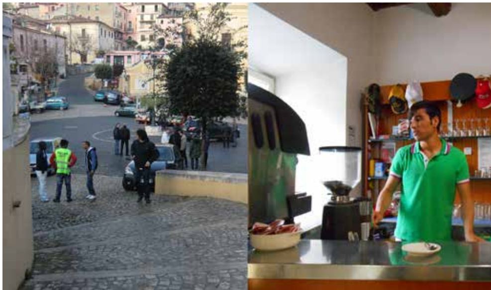
Fig.2 Il lavoro per i rifugiati.

le strutture necessarie da privati e a prezzi di mercato. Oltre alla casa e ai corsi di lingua, gli operatori dello SPRAR fanno da tramite per l'inclusione dei beneficiari nel sistema del welfare locale. Un protocollo tra il Comune, la cooperativa Karibù e l'Azienda Speciale Vola, municipalizzata del Comune che si occupa di servizi locali 6 , stabilisce le forme dell'accesso all'avviamento professionale. Il progetto Oltre i Confini, gestito dall'Azienda Vola, è stato disegnato per consentire ai beneficiari di partecipare ad attività formative sul tema della cultura ambientale e della cura del territorio, ed è frutto dell'incontro tra la domanda di un territorio con poche risorse e la possibilità offerta dall'accoglienza stessa, e di una riflessione maturata localmente tra gli operatori e i rappresentanti locali sull'utilità e la convenienza dell'accoglienza. La cooperativa e la municipalizzata Vola hanno dato avvio ad un progetto formativo e di avviamento al lavoro che facesse della cura degli spazi cui si è chiamati a con-vivere, un tema in grado di unire interessi e bisogni. L'opportunità di integrazione a Roccagorga sembra quindi essere favorita dalla domanda di cura espressa da un territorio in invecchiamento. Ogni rifugiato ha adottato una strada, ed era responsabile della raccolta differenziata e della pulizia delle strade; in questo modo i beneficiari sono stati percepiti positivamente e ben accolti dagli anziani.