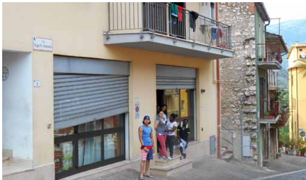
Fig.1 Il B&B recuperato per il centro minori.

che ne faciliti l'accesso ai servizi di welfare locale, e l'avviamento al lavoro con il supporto di progetti e accordi locali disegnati coerentemente alle risorse presenti nel territorio 5 .