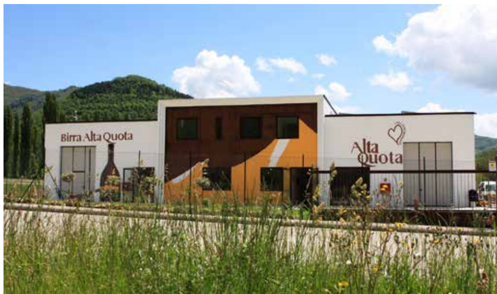
Fig.3_ Il Birrificio Alta Quota. Foto di Cugini G.

zione di uno sportello per la gestione dei ticket a Roccagorga.