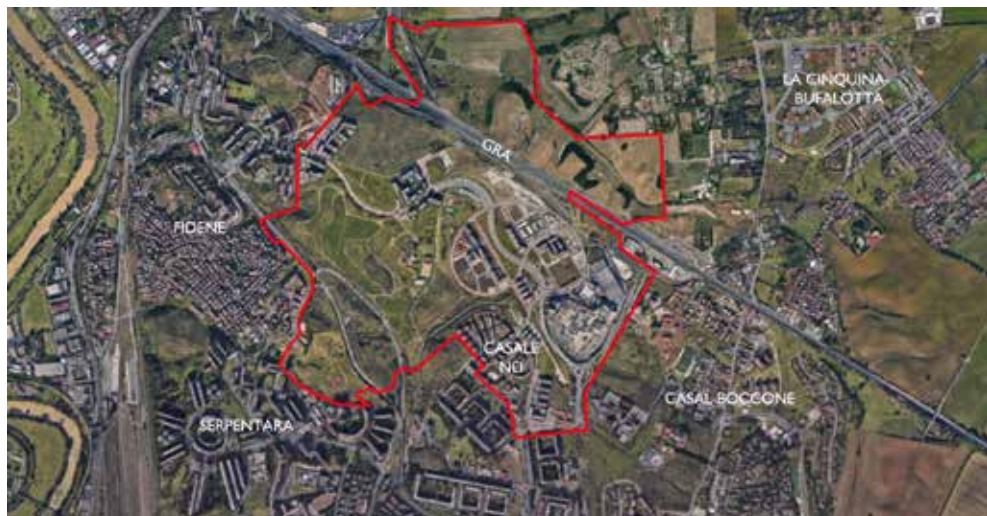
Fig.2 Ortofoto con evidenziati i blocchi residenziali e l'area di Bufalotta (elaborazione degli autori).