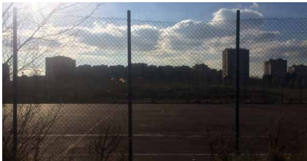
Fig.9 Area del parco compresa tra Viale Carmelo Bene e il Viadotto Giuseppe Saragat (immagine degli autori 2018).

essendo un contratto, sposta il peso decisionale dalla P.A. - che non ha più il potere derivante dall'applicazione delle norme del PRG - al privato che, abituato a operare nel libero mercato, ha maggiore capacità di gestire a suo vantaggio i progetti che realizza. Infatti, gli interventi sono stati realizzati seguendo una gerarchia di interesse che caratterizza quella delle grandi operazioni economico-finanziarie: prima il centro commerciale e le infrastrutture che lo collegano alla rete viaria (bretella G.R.A.), poi le case, infine i servizi e il parco.