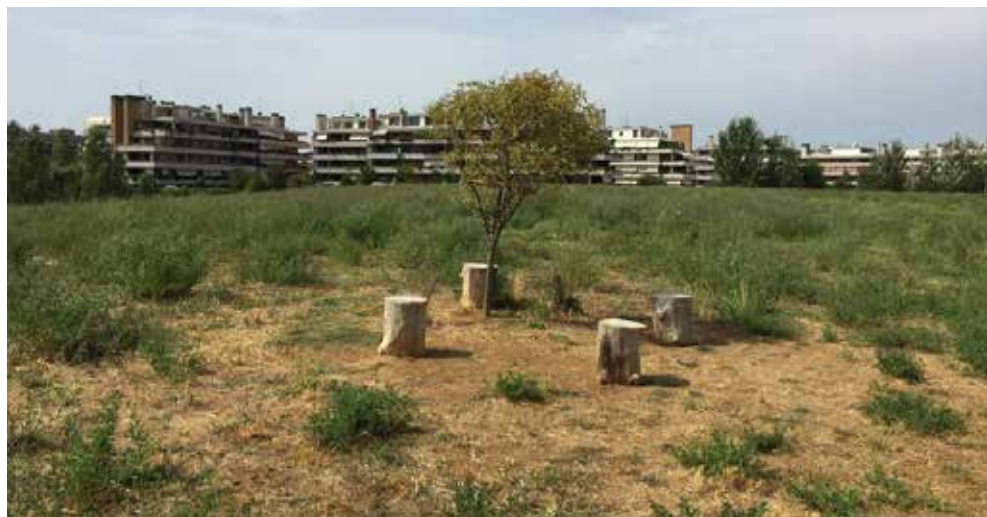
Fig.11 Sedie autoconstruite all'interno del parco.

trasformazioni: disponendo quindi del dato sopra specificato, è calcolabile e ancor più evidente quanto il caso di Bufalotta non rappresenti un esempio positivo di azione pubblica (Tab.3).