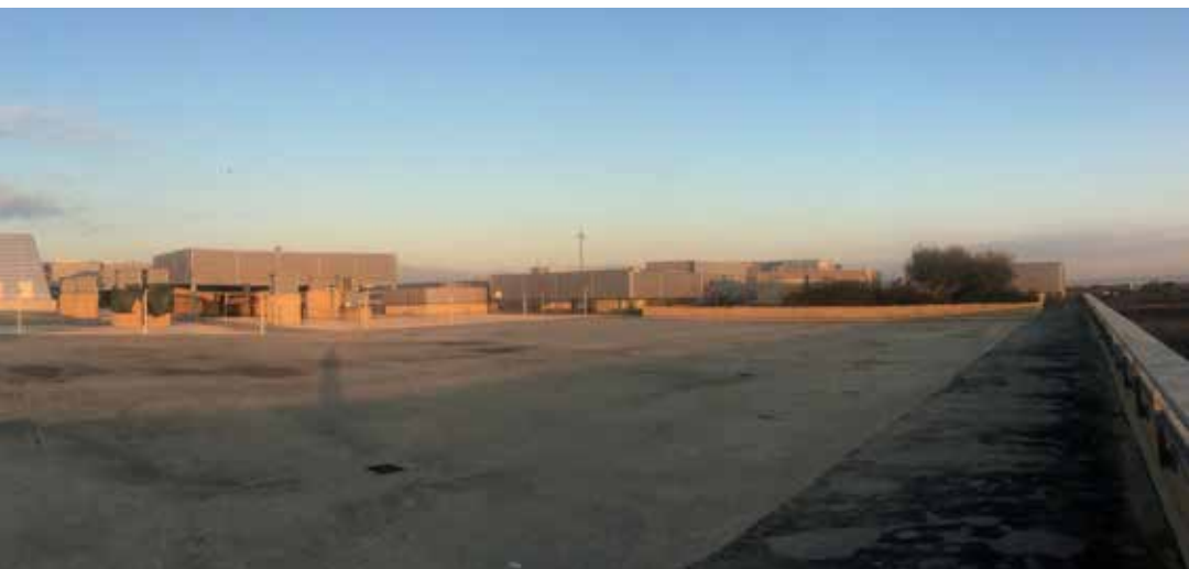
Fig.7 Le terrazze dove erano previsti campi da tennis, calcetto e altre attrezzature (Immagine degli autori 2018).

come parco archeologico né come un vero parco urbano. Considerando le premesse progettuali non è frequentato come ci si aspettava e le sue potenzialità, in termini di biodiversità e di memoria storica, non sono ancora state raccolte.