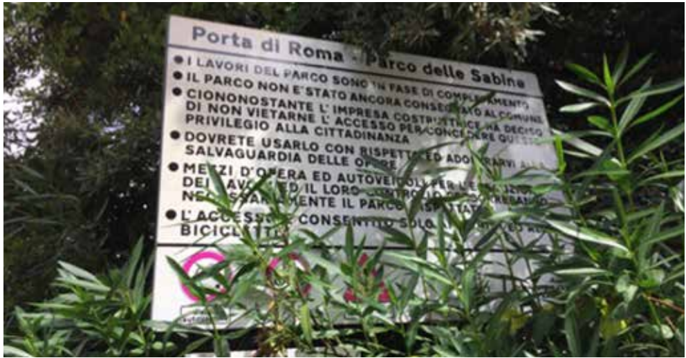
Fig.10 Ingresso al parco da via Monte Grimano.