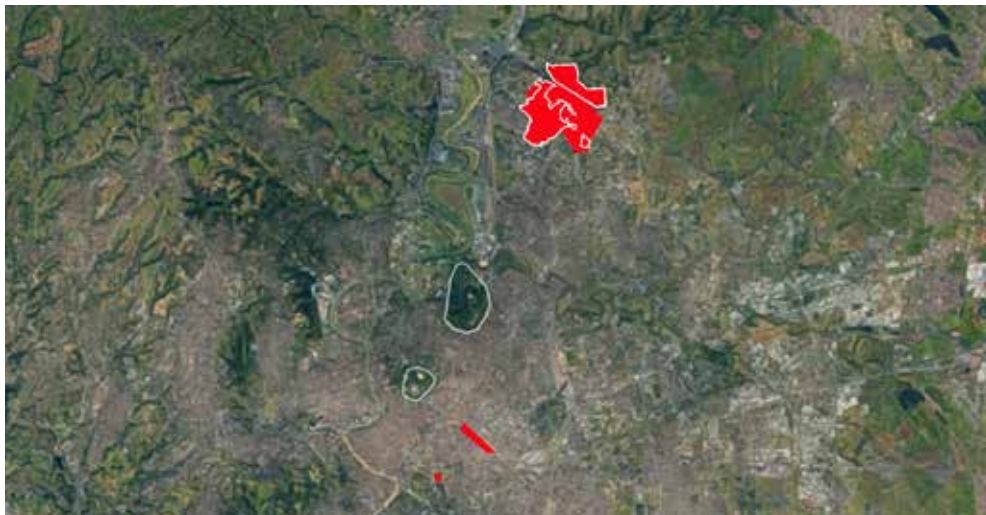
Fig.1 Ortofoto con evidenziati Colosseo, stazione Termini, i parchi di Villa Borghese e Villa Ada, l'area della Bufalotta (elaborazione degli autori).

l'amministrazione di centro-sinistra presieduta dal sindaco Rutelli.